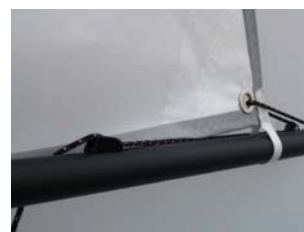
Coupe de la voile soignée (creux et ris de fond)