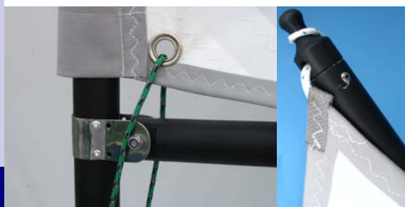
Bôme et livarde imperdables

Ses formes ergonomiques et sa construction solide en polyéthylène rotomoulé en font la nouvelle référence Optimist.