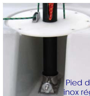
Pied de mât inox réglable

Cunningham et autres réglages de voile opérationnels